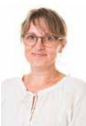
Lilian Keinicke Dansk, engelsk, demokrati