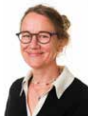
Anette O. Hvingel Dansk, kristendom, historie, billedkunst, demokrati, dansk for tosprogede, specialundervisning, læsevejleder